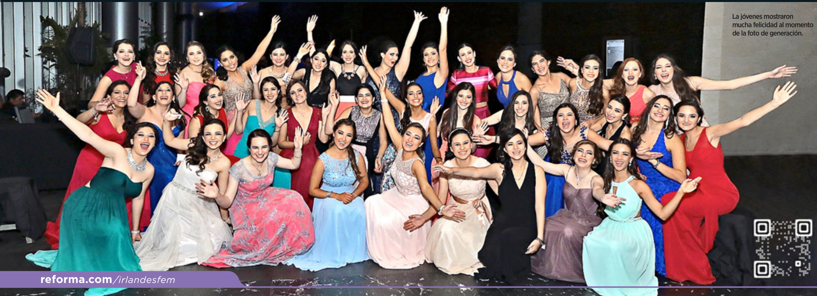
La jóvenes mostraron mucha felicidad al momento de la foto de generación.