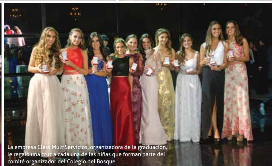
La empresa Class MultiServicios, organizadora de la graduación, le regaló una cruz a cada una de las niñas que forman parte del comité organizador del Colegio del Bosque.